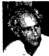
Gian Maria Volontè

● Massenzio. Alle 21 Pret a porter di Robert Altman con Mastrianni Loren Bawinger Roberts Robbins Bacall Ai meè (1994 durata 130) quindi Inuiti molto speciali di Charles Shyer con Nick Nolte e Julia Roberts (1994 118) infine Il figlio di Spartacus di Sergio Corbucci (1962 108) schermo piccolo per la serie Honorarium est alle 21.30 Sotto shock di Wes Craven (1989 109) a seguire Henry pioggia di sangue di John McNaughton (1987 85) conclude La notte dei mille gatti di Harry Stewart (1975 85) Domani serata dedicata a Gian Maria Volontè alle 21 Il tiranno Bandejas di Jos Luis Garcia Sanchez Parte aperte di Gianni Amelio e A ciascuno il suo di Elio Petri Ingresso 10 mila lire entrata in via di San Gregorio e in via Parco del Celio lato Colosseo