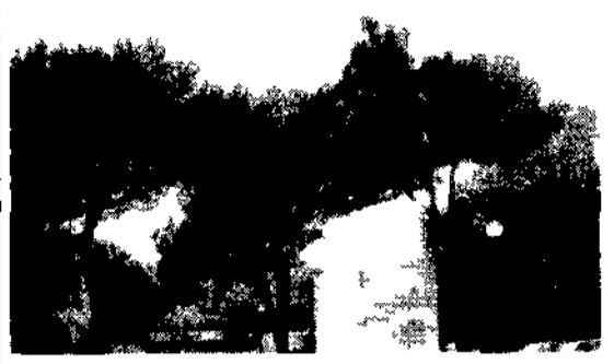
Scendendo a valle dall'Avventino si arriva allo sgarzo di piazza Albania, intitolata precedentemente alla porta «Raudusculana» che si apriva sulle mura Serviane, delle quali sul lato destro della piazza restano ancora alcuni metri. Al centro troneggia un classico monumento equestre dedicato a Giorgio Castriota Scanderberg, del '40. In fondo, alla fine del Parco della Resistenza, vale la pena andare a guardare l'edificio dell'Ufficio postale, bellissimo esempio del razionalismo a Roma, di Libera e De Renzi, 1933-'35.