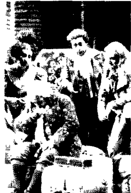
Una scena dell'opera di Rossini «La cambiale di matrimonio»

LONDRA. Claudio Abbado è stato il direttore artistico del festival di Edimburgo. Il festival è un'opera di propaganda che si occupa di un periodo storico che è ancora oggi molto attuale.