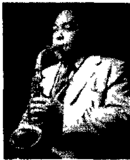
A sinistra, Charlie Parker. Sotto, Roberto Benigni. A destra, Peppino De Filippo e, in basso Beppe Grillo. Nella foto grande Ettore Petrolini nel ruolo di Gastone, nel 1921.