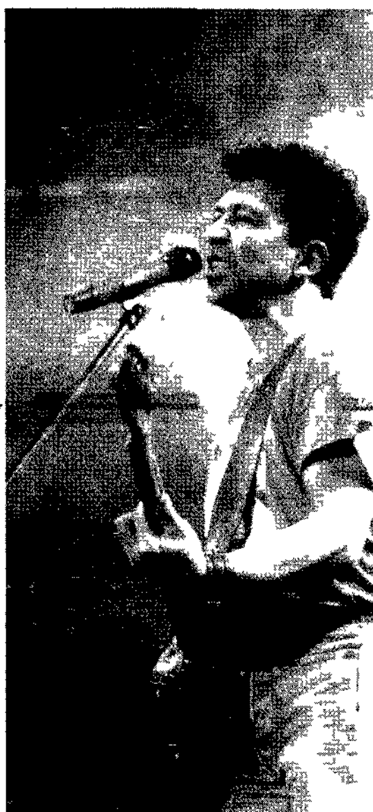
Edoardo Bennato e in alto Paola Turci