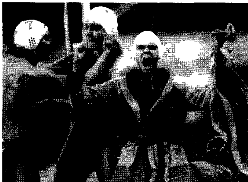
Oro agli Europei per la nazionale di pallanuoto. L'esultanza degli azzurri

stare il comando è stato tradito dopo solo quattro giri dalla rottura di una sospensione. L'austriaco che non è riuscito a sfruttare la pole position conquistata sabato si è fermato per un guasto al sistema elettronico.