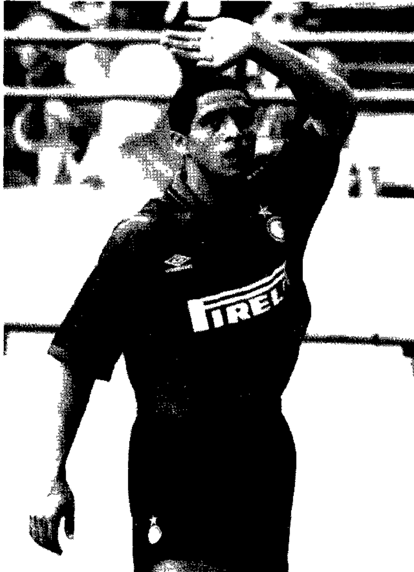
Roberto Carlos saluta il pubblico di S. Siro dopo aver segnato il gol della vittoria dell'Inter

no c'è stato le penne e allora tutti contenti però attenzione, passano i giorni e Baggio non ha più troppe tempo per mettersi in riga. Soltanto la notte la notte con lui fanno nei suoi riguardi. Lo stesso Sacchi conferma: "Puggio. Si stava bene. Frase chiara, chiassosa. Una volta si diceva: Baggio. Lo aspettiamo. Ora nessuno lo aspetta più. Sbagliato è chi a Baggio oggi un calciatore, molto solo."