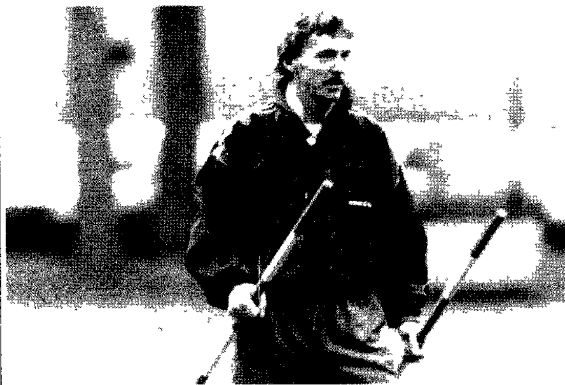
Zbigniew Boniek allenatore dell'Avellino