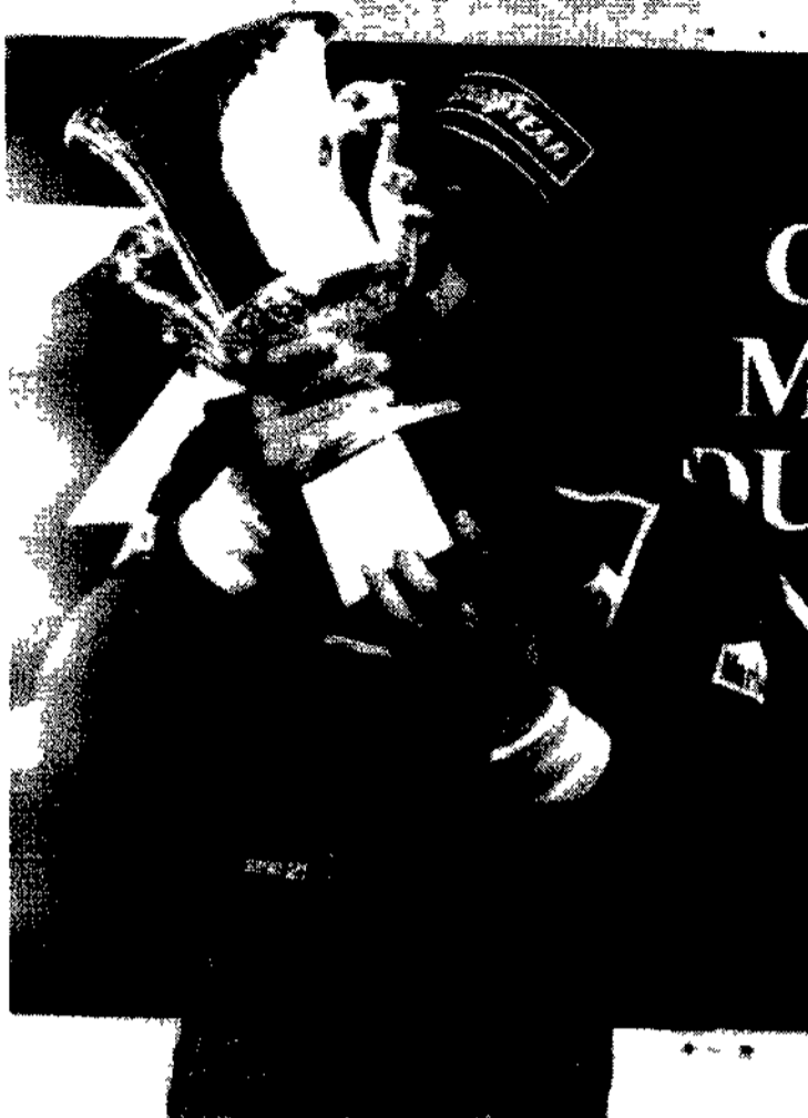
Berger pronostica il podio per Alesi al Gp d'Italia a Monza

Risultati Singolare maschile Stich b J. Sanchez 6 2 6 3 6 3 Singolare femminile Sanchez b Kruger 6 4 6 3 Hingis b Maleeva 4 6 6 4 6 2 Perk e b Tecenec 6 6 3 6 0