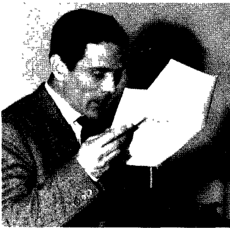
Pier Paolo Pasolini durante un convegno negli anni 60

«La sua critica poteva aiutarci a salvare la Dc. Non cercai l'incontro con lui perché era omosessuale»