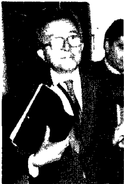
Il senatore a vita Giulio Andreotti