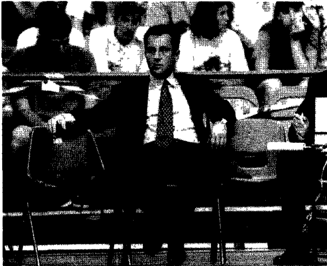
L'allenatore della nazionale Julio Velasco