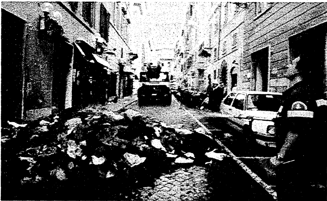
Le fasi finali dello spegnimento da parte dei vigili del Fuoco al negozio di Kenzo