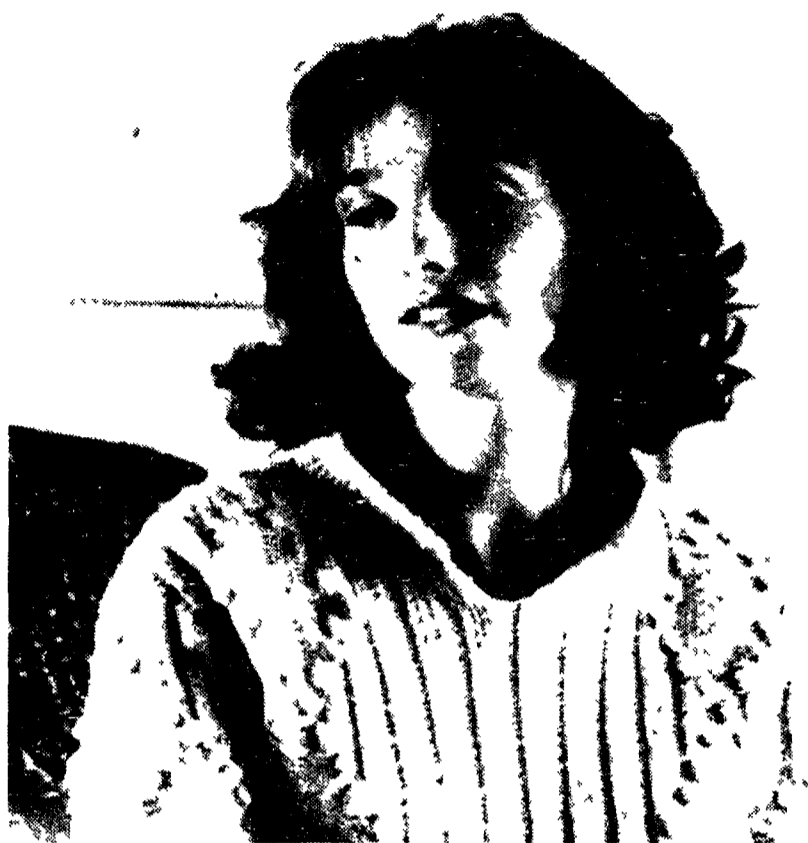
L'attrice Lorenza Indovina in «Non parlo più» miniserie di Raidue