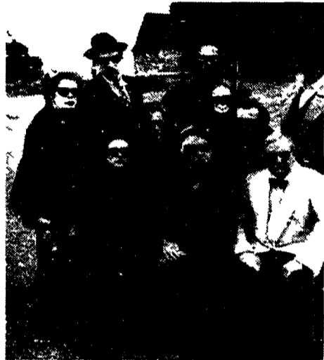
Il cast del film. Nel bel mezzo di un gelido inverno diretto da Kenneth Branagh

compagnia di guitti infami, tutti «quattnnati come lui, e li trascina in campagna dove la tragedia del pallido prence verrà ambientata in una chiesa «consacrata dove i malcapitati dovranno anche vivere, dormire e mangiare...»