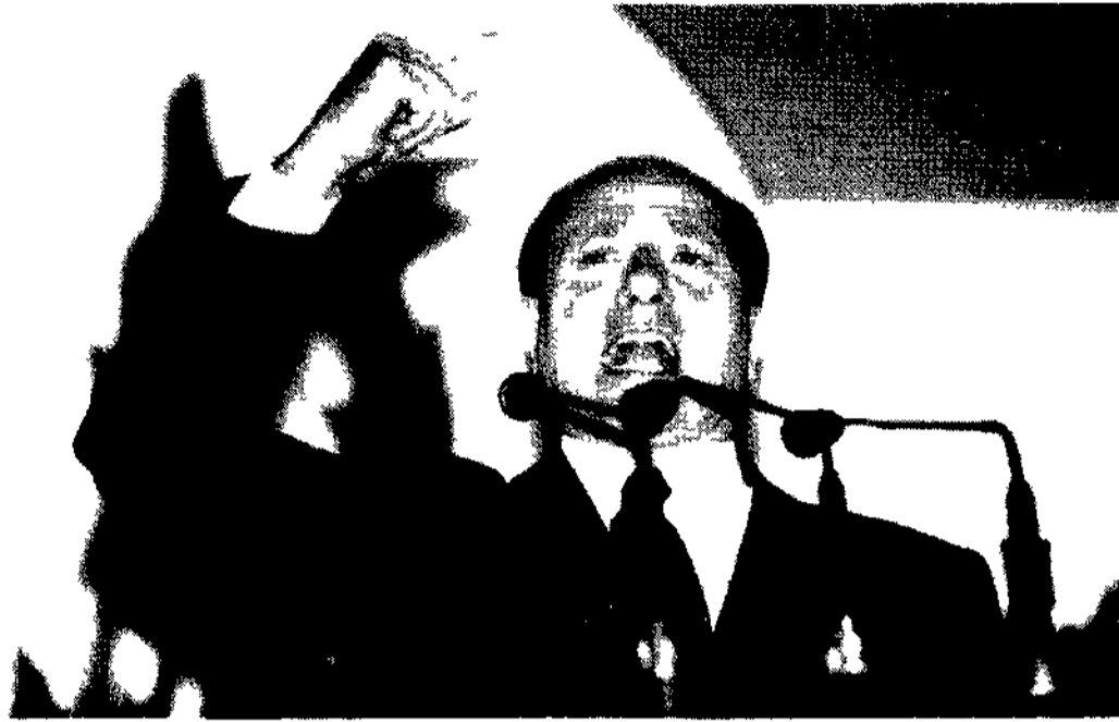
Silvio Berlusconi. A destra, Clemente Mastella