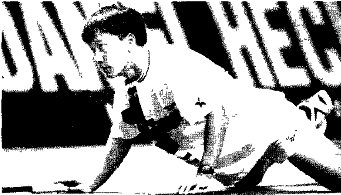
Lo statunitense Michael Chang a terra durante la finale Atp