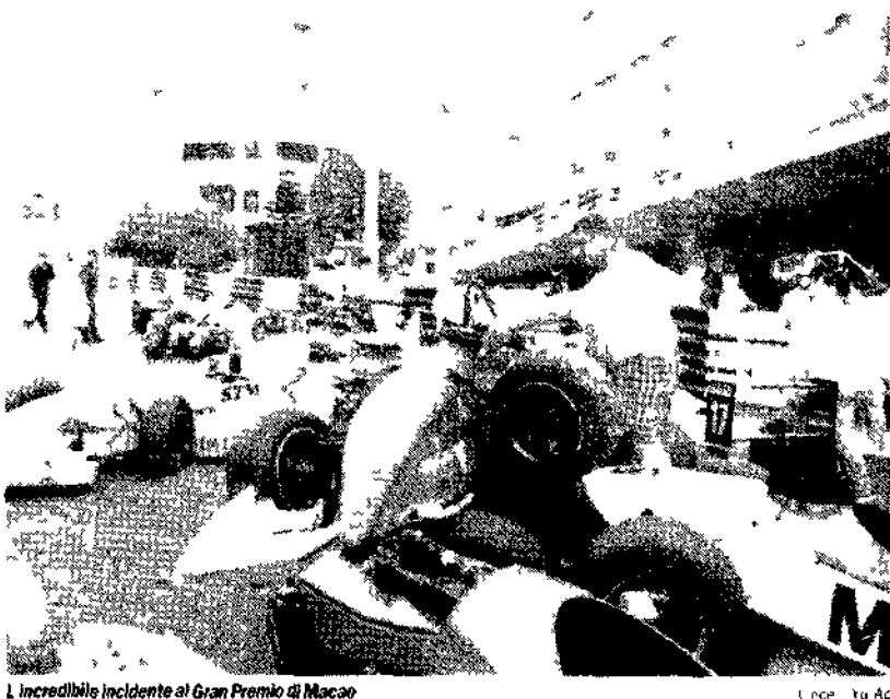
L'incredibile incidente al Gran Premio di Macao