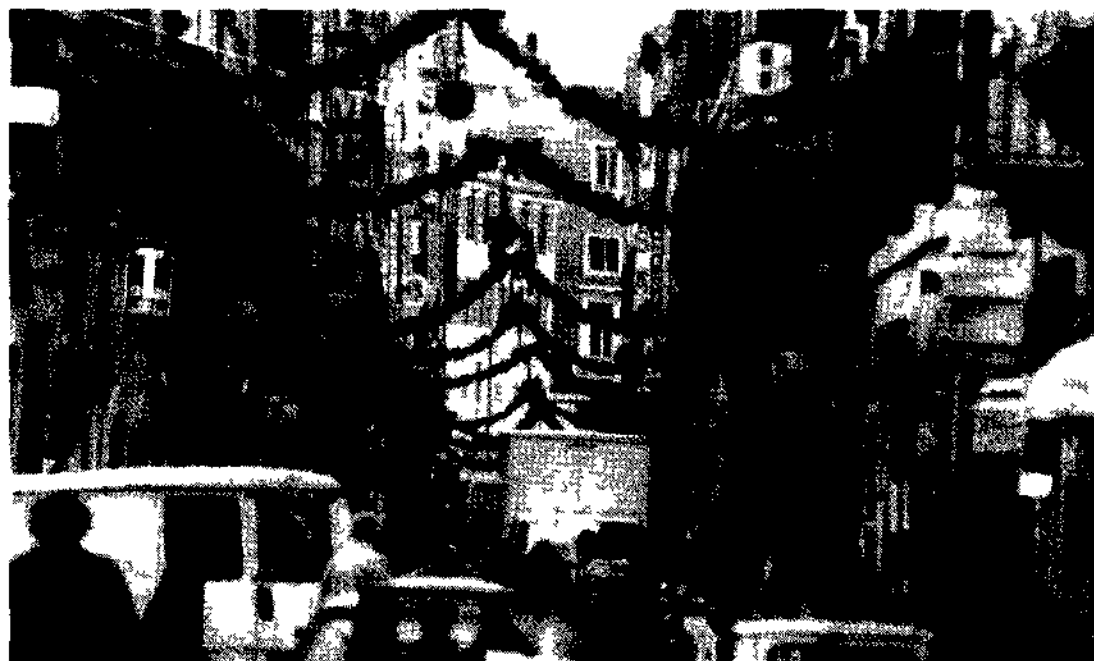
Shopping natalizio in una strada del centro