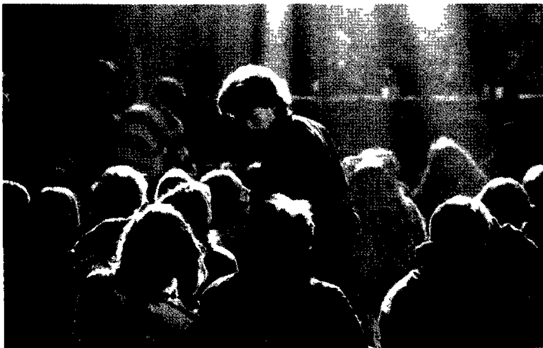
Assemblea degli studenti al Mamiani autogestito