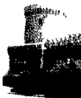
Castello Giulio II

● Si avvia alla conclusione l'XI settimana per i Beni Culturali e Ambientali che prevede l'ingresso gratuito e l'apertura straordinaria di musei, ville, monumenti e necropoli. Tra le tante iniziative in corso segnaliamo ● Etruschi sotto sopra. La manifestazione che si concluderà domani offre la possibilità di scoprire i tesori artistici e le bellezze paesaggistiche dell'Etruria meridionale. Le città visitate sono Roma, S. Severa, Civitavecchia e Tarquinia. Nella capitale il Museo etrusco di villa Giulia promuove ogni giorno due visite guidate (alle 15 e alle 17) rispettivamente alla villa e al museo. A S. Severa è possibile visitare dalle 10 alle 15 il santuario e l'antiquarium di Pyrgi. Il Museo nazionale archeologico di Civitavecchia promuove visite a ciclo continuo dalle 9 alle 19 con servizio di navetta per le Terme Taurine (ore 10-15) villa imperiale romana. Anche il Museo nazionale archeologico di Tarquinia è aperto dalle 9 alle 19 e organizza bus per la necropoli (ore 10-15) e per i resti dell'abitato etrusco di Gravisca. Per informazioni chiamare il 37 23 234. ● Ostia Antica e Fregene. Molte le visite guidate promosse dalla Soprintendenza archeologica di Ostia: oggi alle 10 le tombe dei Claudii presso gli scavi di Ostia Antica e i Fregene; il Museo delle Navi (via Guidoni 35) il porto