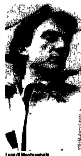
Luca di Montezemolo

lentieri quella titolare che deve ancora conquistare la qualificazione per le Olimpiadi di Atlanta. Nell'Italia di ieri tra gli altri c'erano due esordienti di «russo» Gianluigi Buffon il portiere del Parma non ancora diciottenne e il romanista Francesco Totti. Bene il giallorosso autore del gol che ha sbloccato il risultato nel primo tempo. Da rivedere Buffon per lui è stata una partita da spettatore. L'attacco bulgaro ha lasciato a riposo Chissà magari nel futuro immediato per i due potrebbero esserci maglie da titolari. Al di là dei nomi nuovi c'è stata anche un'altra novità. Il ct Maldini ha provato un modulo che in passato aveva sempre snobbato. Nonostante andasse per la maggiore nell'Italia di Sacchi il 4-4-2. A dire il vero per lunghe fasi della partita ha prevalso forse anche inconsapevolmente il vecchio 5-3-2. Ma in ogni caso la scelta di schierare quattro difensori in linea è una mezza rivoluzione nell'under 21. Forse per segnare una certa continuità col ct della nazionale maggiore. O forse solamente per vedere quello che sarebbe successo in campo. Continuo sia l'Italia non ha entusiasmo. Intendiamo il ri-