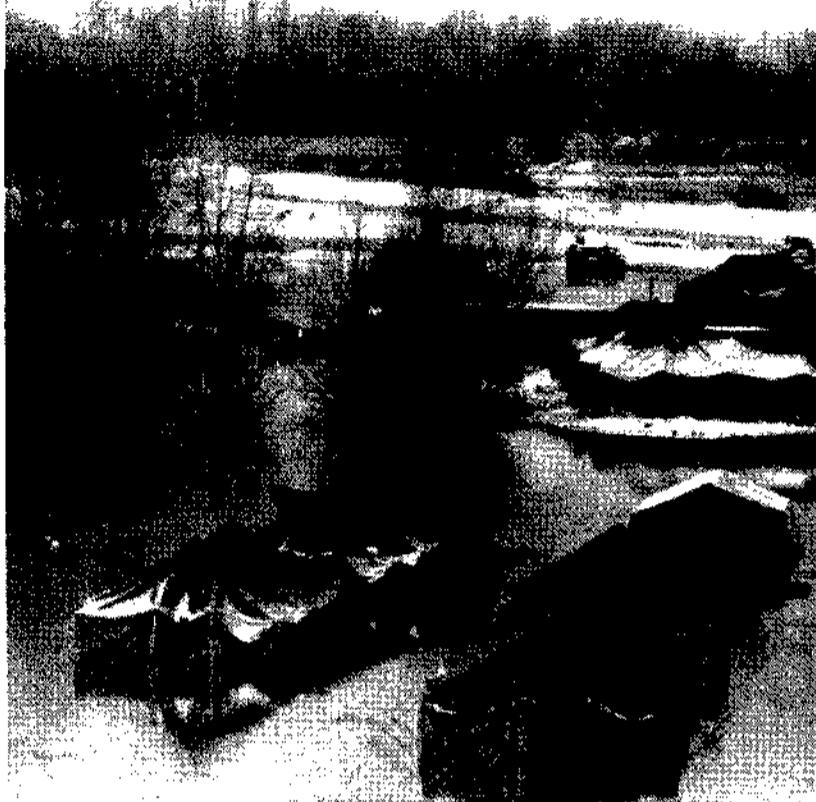
Un campo di tende di militari americani, allagato dalle piogge