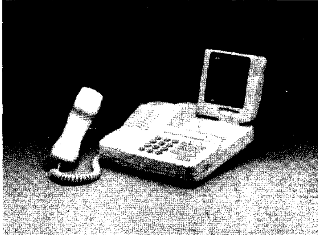
Videotelefono «Nexus 2000»

Emozioni nuove al telefono, dunque: il piacere di parlare, guardandosi negli occhi, anche a centinaia di chilometri di distanza.