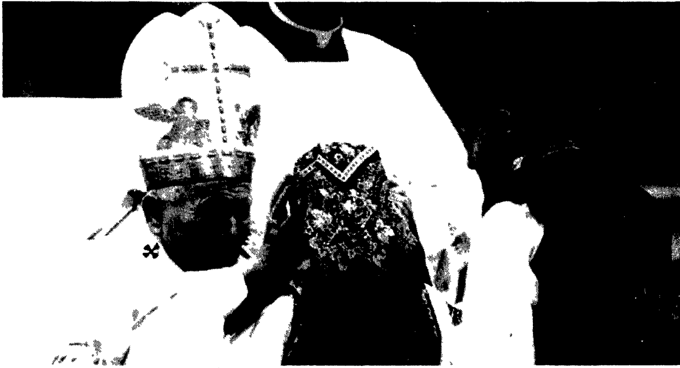
Il Pontefice durante la celebrazione della Giornata mondiale della pace

Bill Clinton ha trascorso il Capodanno su di un'isola della Carolina del Sud. Oltre ai familiari c'erano mille persone circa, fra cui molti intellettuali. Una sorta di ritiro spirituale, nella località di Hilton Head, con tavole rotonde su argomenti come «La vergogna, la moralità, l'educazione e la cultura pop», nell'ambito del cosiddetto Renaissance Weekend.