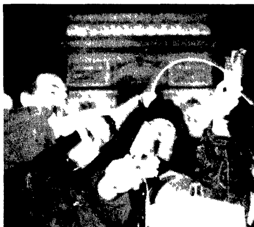
Dall'alto: la folla a Times Square a New York, il brindisi agli Champs Elysees a Parigi e i fuochi d'artificio alla porta di Brandeburgo a Berlino