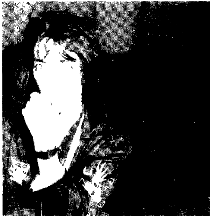
Patti Smith in una foto degli anni 70