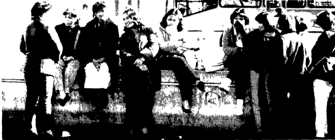
Un gruppo di giovani filippine alla stazione Termini

Da ieri sera il Campidoglio è multietnico. O almeno un po' più colorato di ieri in poi infatti accanto ai sessanta consiglieri comunali con passaporto italiano in tasca siederanno quattro consiglieri aggiunti in rappresentanza di quasi 200.000 immigrati dai cinque continenti che vivono, lavorano o studiano a Roma. Non potranno votare gli aggiunti ma avranno potere di intervento e proposta in consiglio e nelle commissioni e non solo sulle questioni che riguardano l'immigrazione. È lo stesso avvenire nelle 19 circoscrizioni della Capitale che avranno ognuna il proprio rappresentante straniero.