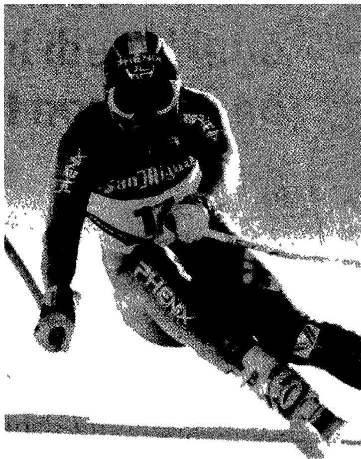
Atle Skaardal; il vincitore dello slalom gigante