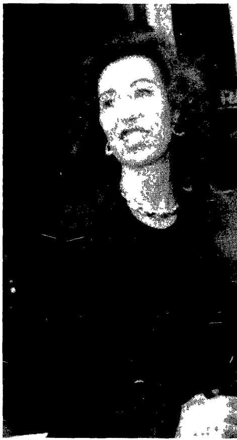
Il presidente della Rai Letizia Moratti

«Sono molto soddisfatti - ha commentato Letizia Moratti - Abbiamo chiesto alla commissione solamente di essere messi nelle stesse condizioni di Tele+ 2 di poter partecipare all'asta per tutto il pacchetto compresi i diritti per la pay per view. Allo stato attuale noi non possiamo concorrere. Però mi sembra che in commissione ci sia una larga maggioranza che richiede il rinvio dell'asta perché ci siano le condizioni di chiarezza e trasparenza sia per l'aggiudicazione sia per l'individuazione dei soggetti abilitati a concorrere. Il nostro progetto pay per view prevede un percorso aziendale complesso che passa anche per la rinegoziazione del canone verso il basso».