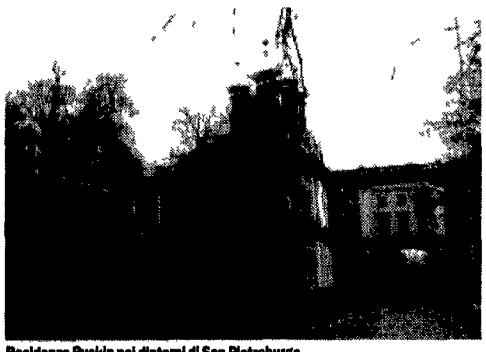
Residenza Pushkin nei dintorni di San Pietroburgo

viaggi individuali e di gruppo in Italia e all'estero crociere e soggiorni al mare e ai monti nozze e cunose dove, quando e a quanto