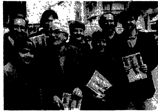
La redazione di «Scarp de' tennis»