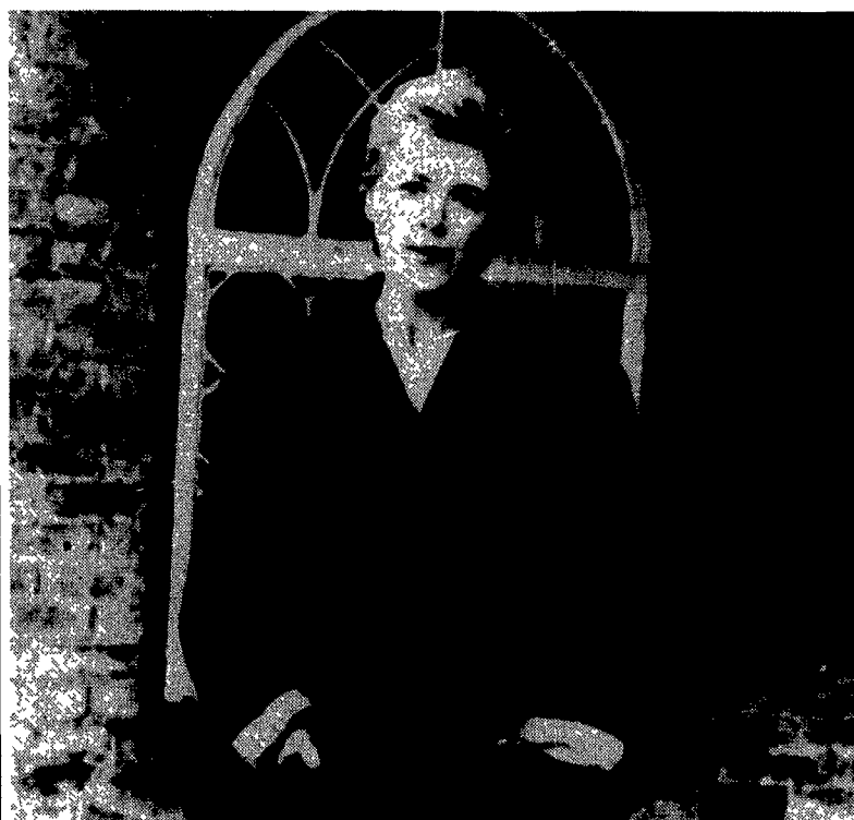
Recital di Marianne Faithfull stasera ai Magazzini Generali

che a quei quindicimila ragazzi tra i quindici e i vent'anni che oggi a Milano, pur avendo magari una casa, non frequentano scuole né lavorano. Scarp de'tennis potrebbe essere un'opportunità anche per loro». Il primo numero del mensile contiene, tra l'altro, un servizio sull'opportunità appena conquistata dai barboni di vedersi riconosciuta la residenza anagrafica, un testo di Bruno Brancher e la mappa delle strutture pubbliche e private di assistenza ai senza dimora e la storia dell'associazione «Cena dell'amicizia».