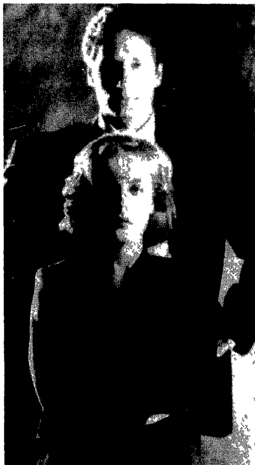
David Duchovny e Gillian Anderson protagonisti di «X-Files».