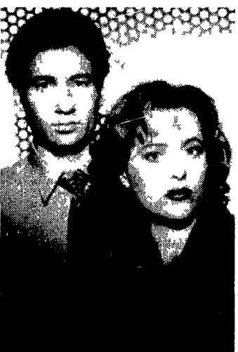
I protagonisti della serie televisiva X-Files

te del suo specialissimo fascino. Dunque son questi gli ingredienti che hanno creato un nuovo mito televisivo. Nato negli Usa nell'ottobre del '93 non senza grandi difficoltà (la stessa Fox non era entusiasta del progetto) il programma vincitore del Golden Globe come miglior serie drammatica del '94 approdato in Italia un paio d'anni fa è attualmente seguito da un pubblico di cinque milioni di telespettatori a serata. Ma nato il mito il lancio promozionale continua. Si rafforza. E così è in svolgimento in questi giorni la campagna di presentazione di quattro videocassette sulle avventure dei due agenti del Fbi Mulder e Scully. Aprirà la collezione The Unopened File (sconosciuta al pubblico italiano) cui seguiranno Tooms Abduction e Color . E mentre ogni domenica sera alle 20.30 su Italia 1 continua la programmazione della serie di episodi (in replica) nelle città italiane si organizzano incontri ravvicinati con i telefilm americani del mistero. Per la Fox si tratta di un giro d'affari da 160 milioni di dollari. 8 dei quali provengono dall'Italia. Ma torniamo alle iniziative di