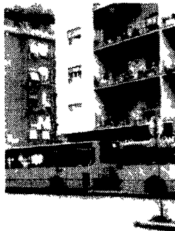
Piazza Imerio Sotto, uno degli edifici di Valle Aurelia.