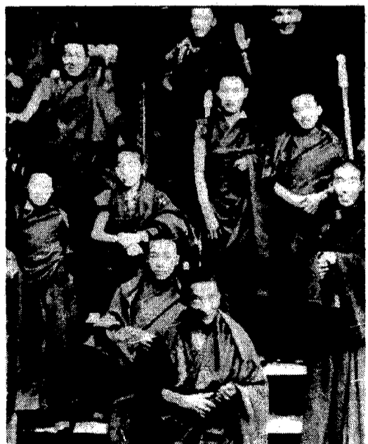
Monaci tibetani del monastero di Shekar, dalla mostra di Richard Gere

dica permanente 3883 - Pronto soccorso ortopedico 583801 - Telefono amico 6366 - Amicotell 700200 - Telefono azzurro 051/261242 - Centro bambino maltrattato 6456705 - Casa d'accoglienza della donna maltrattata 55015519 - Telefono donna 809221 - Centro ascolto problemi alcolcorrelati 33029701 - Viabilità autostrade 194 - Informazioni aerei 74852200 - Informazioni Fs Centrale 67500 - Porta Garibaldi 6552078 - Ferrovie Nord 48066771 - Aem elettricità 3692 - Aem gas 5255 - Enel segnalaz. guasti 16441 - Acquedotto 4120910 - Sip 182 - Aci 116 - Sos randagi 70120366 TRASPORTI Aeroporti: Linate 7380233 738113; Malpensa 7382131 7491141. Alitalia, informazioni nebbia 70125959 - 70125963. Ferrovie dello Stato, Stazione Centrale 67500; informazioni treni: per Genova-Ventimiglia 66984611; per Bologna 66984617; per Venezia 66984624; per Como, Sondrio, Tirano 66984626, per Torino-Domodossola 66984628. Treni in arrivo alla Centrale 66984615. Ferrovie Nord 85111 (informazioni) Avis 6981; Hertz 654929; Limousine Service 344752. MERCATI Via Zuretti, piazzale Martini, via G. Borsi, via M. De Capitani, Via Gaeta/Sand, via Val di Ledro, via Vitorelli, viale Monza, via Rancati, via Cima, via Cermenate, via Giussani, via Vespi Siciliani, via Bentiavoglio, via Flammignino, via Paretto.