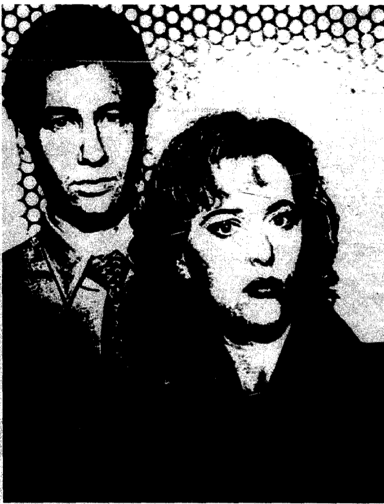
Gli agenti dell'Fbi Fox Mulder e Dana Scully protagonisti del serial X Files

Richard Gere porta il Tibet in Prima Classe, nelle vetrine di via Montenapoleone. Sempre più vicino al dramma dei 120mila profughi in fuga dal «tetto del mondo» sotto la guida del Dalai Lama, l'attore americano si accinge a sbarcare a Milano con una operazione di beneficenza. Nel corso di quello che definisce il suo «viaggio spirituale partito nel '78 da un campo di rifugiati nei dintorni di Pokhara in Nepal, l'«American Gigoletto» ha realizzato una serie di fotografie tra le diverse comunità tibetane. Le immagini in bianco e nero testimoniano la lotta non violenta di tali minoranze per la sopravvivenza della loro cultura a rischio da quando la Cina ha invaso il Tibet. Ma questo reportage è anche lo strumento col quale Gere intende sostenere concretamente la causa degli esuli e dal Dalai Lama. Così, riunite nella mostra «Zanskar and Tibet: the pure realm» e tirate in una edizione limitata di 25 stampe con 4 prove d'artista, le foto dell'attore saranno esposte in una mostra itinerante. Quindi, verranno vendute a prezzi - va da sé - amatore. L'operazione i cui ricavi saranno interamente devoluti alla Gere Foundation per il Tibet, partirà da Palermo, con la benedizione del Dalai Lama in carne ed ossa, per approdare a Milano il mese