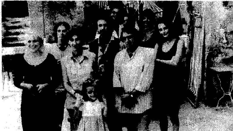
Una scena del film «Ferie d'agosto» di Paolo Virzi