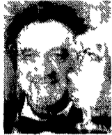
Il compositore Bacalov

dizioni etniche e al tempo stesso attraversando generi musicali con temporanei. Il gruppo presenta brani dall'ultimo disco Tuareg In via Aurelia 1051 Telefono 5880026 Ingresso lire 15mila