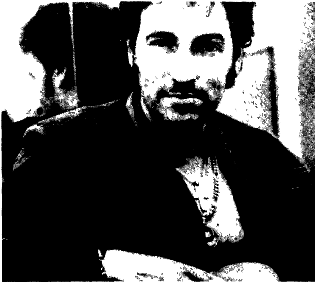
Stasera allo Smeraldo la seconda data italiana del tour di Bruce Springsteen