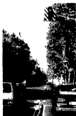
Via Nomentana. Sotto, Piazza Sempione a Montesacro