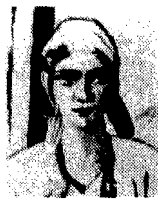
Un quadro di Beckmann

● Passeggiate a Cerveteri. Per riscoprire i luoghi e la storia di una delle più importanti città del Mediterraneo antico, la Pro-loco di Ladispoli e il gruppo archeologico romano promuovono una serie di itinerari guidati attraverso l'antica Caere. Domenica verrà percorsa la via degli Inferi tra la città e la Necropoli: l'appuntamento è alle 9.30 all'ingresso degli scavi della necropoli. La passeggiata termina all'ora di pranzo e non costa nulla. Inf.: 06/9913049. ● Non aprite quelle vite. È il nome dell'iniziativa promossa dall'associazione Let em in, con il patrocinio della regione Lazio, finalizzata all'apertura di alcune residenze storiche della provincia di Viterbo dall'alto valore storico-artistico, abitualmente chiuse al pubblico: domenica, con la guida di uno storico dell'arte, sarà possibile visitare Palazzo Altieri ad Oriolo Romano (ore 10.30 e 12.30) e villa Staderini a Sutri (stessi orari). La partecipazione è gratuita, e il punto d'incontro è all'ingresso delle residenze. Inf.: 5576365 - 5515865. ● Max Beckmann. L'opera di uno dei maggiori esponenti della Nuova Oggettività tedesca - la corrente neo espressionista sorta in Germania fra le due guerre - nella mostra della Galleria nazionale d'arte moderna, che espone circa cento dipinti, disegni e sculture dell'artista. L'associazione Artemigrante organizza domani alle 11 una visita guidata alla mostra: l'appuntamento è in viale delle Belle arti 11, il costo della