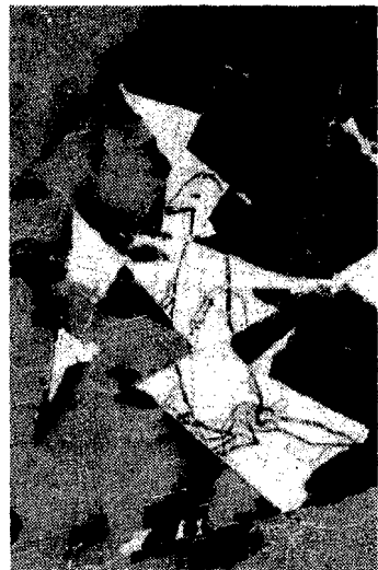
Un collage di Maria Lai, 1993

Biblioteca Casanatense, Via S. Ignazio, 52. Ore 8,30-13 lunedì, mercoledì e sabato; 8,30-19 martedì, giovedì e venerdì. Ingresso libero. Tel: 6796839.