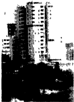
Alcune vedute di Grotta Rossa Antonio Bozzard Nuova Cronaca