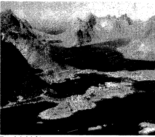
Norvegia, isole Lofoten

titolata al grande compositore che musicò il Peer Gynt di Ibsen e di cui si può visitare la vittoriana residenza estiva. La frenesia del porto - tappa obbligata per chi risale la costa verso Capo Nord con il «postale» o le navi da crociera - non ha riscontro nella città che si anima solo al mattino quando al vertice del vecchio porticciolo prende a vivere il mercato del pesce con bancarelle traboccanti di rossi gamberi e bianchi merluzzi, e dove ci si può fare un panino col saporito salmone affumicato.