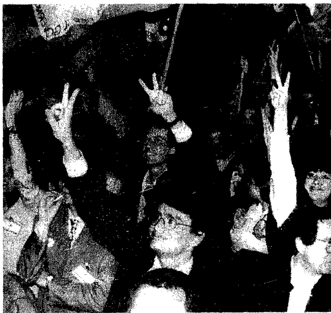
Alcune immagini dei sostenitori dell'Ulivo in piazza Santi Apostoli