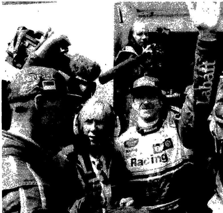
Michael Schumacher, a sinistra, e Damon Hill durante una pausa delle prove di qualificazione

potranno cambiare la prossima settimana ad Imola. Alla fine delle prove ufficiali, la folla tedesca ha tributato un'ovazione al campione del mondo, ma Michael Schumacher non ha nascosto di aver inutilmente sperato in un risultato migliore. «Su questo circuito la macchina è molto importante e noi non siamo ancora ad un livello di prestazioni che ci possa permettere di lottare contro le Williams - ha detto il campione del mondo -. In mattinata sulla mia vettura si era rotto un motore, lo abbiamo cambiato e forse il propulsore utilizzato nel pomeriggio era un po' meno potente. Ciò può spiegare l'entità del distacco, superiore al secondo. Ma non mi sento frustra-