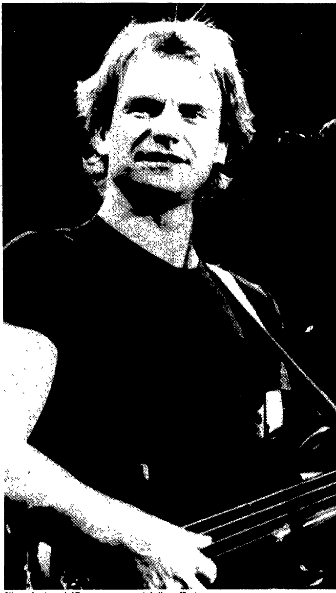
Sting arriva domani al Forum con un concerto bello e raffinato

In chiusura ci sarà un concerto di Giancarlo Onorato e U.L., nome molto conosciuto nell'ambito del rock italiano alternativo.