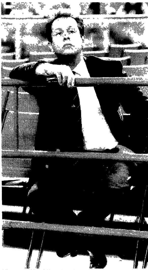
Julio Velasco «ad Atlanta dobbiamo vincere l'oro»

problema del cambiamento e in questo i più conservatori sono proprio giocatori e allenatori. Io penso che il nostro gioco sia troppo logico, che nel 99% dei casi la squadra più forte finisce per vincere la partita. Non è come nel calcio dove magari uno si difende per 90 minuti e poi azzecca l'azione di contropiede. Servirebbe qualche nuova regola che aumenti l'incertezza, ma sarà comunque difficile farla digerire». «Non trascuro il problema di una mia sovraesposizione presso l'opinione pubblica. Negli ultimi mesi ho partecipato ad una sola trasmissione televisiva. Quando entri nel meccanismo dei media non riesci più a controllarlo. Qualche tempo fa è comparsa su un settimanale un'intervista che io non ho mai concesso. Non solo, hanno pubblicato la foto di mia madre scambiandola per mia moglie».