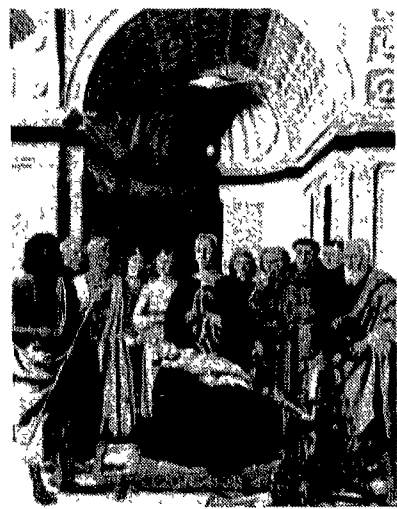
Da sinistra a destra: «Sacra Conversazione» di Piero della Francesca alla Pinacoteca di Brera; «Sant'Agostino» e «San Nicola da Tolentino» dal politico agostiniano ora restaurati ed esposti ai Poldi Pezzoli