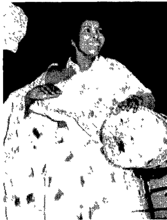
L'Extrafesta è stasera al Palatrussardi

■ L'Extrafesta raddoppia. L'appuntamento annuale con la musica e la cultura dal Sud del Mondo proposto da Radio Popolare - giunto all'undicesima edizione - quest'anno cresce a due serate. E domani pomeriggio, con Extrafesta Bambini, spettacoli di artisti di strada, clown e giochi nonché esibizione dei 40 suonatori di tamburi under 16 dei Mitoka Samba per i più piccoli. Sul palco del Palatrussardi, stasera e sabato sera a partire dalle 20,30, world music da Salvador de Bahia e dalle isole Comore all'insegna della contaminazione musicale. Inoltre piatti tipici, cocktails e birre sono in vendita negli stand delle comunità straniere. Apre la manifestazione il gruppo Gam-Gam, dalle Isole Comore, 8 musicisti e due ballerine con la loro musica tra cultura nera e araba, nonché suggestioni rock e reggae. È la volta poi di Daniele Sepe, passato dal jazz alla canzone napoletana e alla world music. Star di domani sono sicuramente i brasiliani Olodum, venti elementi, già conosciuti al grande pubblico per la partecipazione all'ultimo video di Michael Jackson e all'album «The Rhythm of the Saints» di Paul Simon. Di seguito gli italiani «Taken to the Bottle» e «Jubilee Shouters». Ingresso a una sera lire 20mila, cumulativo per l'intera manifestazione 30 mila lire, mentre Extrafesta Bambini - domani nel prato antistante il teatro tenda dalle 15,00 alle 19,00 - è gratis.