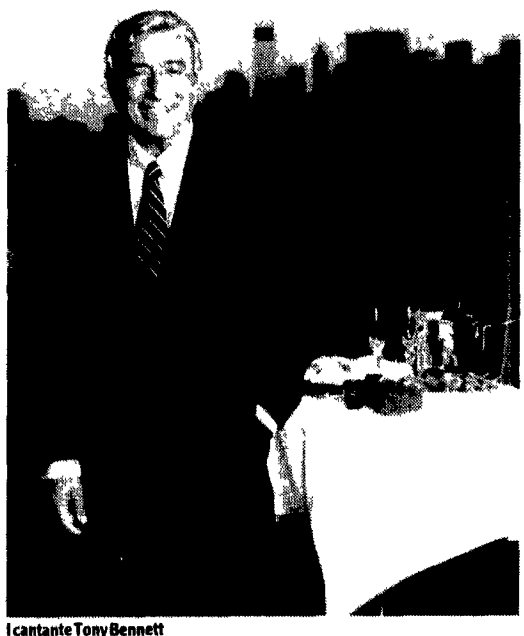
Il cantante Tony Bennett

ni come I Left My Heart in San Francisco divenne presto uno degli interpreti più apprezzati della canzone leggera americana che lui definisce «un curioso miscuglio di musica ebraica di Broadway e musica nera degli artisti jazz qualcosa che può nascere solo in un paese come l'America!». I suoi punti di riferimento sono stati soprattutto le donne: da Sarah Vaughan a Judy Garland fino a Lena Horne con cui ha spesso cantato in tournée. E alle donne è dedicato il suo ultimo disco il 29esimo della sua carriera Hearts to the Ladies diciotto canzoni omaggio ad artiste come Barbra Streisand Peggy Lee Sarah Vaughan. Per il concerto di Bennett questa sera al Sistina ci sono biglietti disponibili a 50 mila lire 64 mila 77 mila 82 mila e 100 mila (poltronissima).