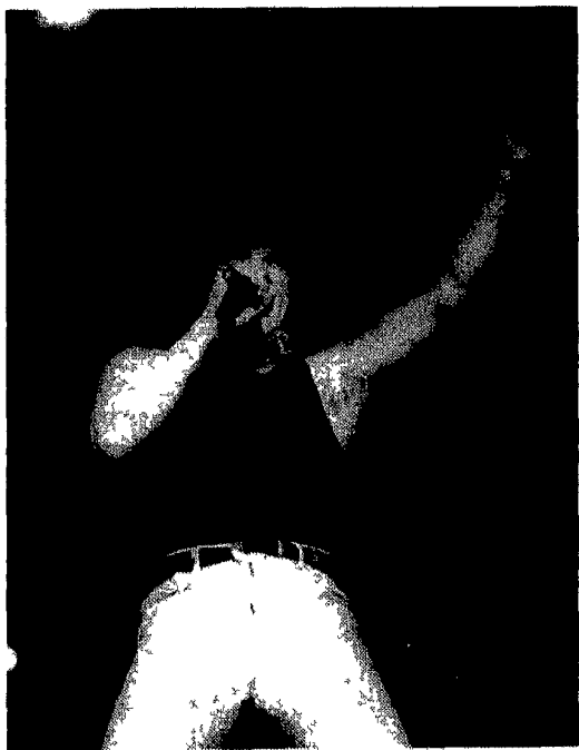
Un vecchio concerto degli AC/DC

successo come Back in Black (che ha venduto oltre dieci milioni di copie), Who Made Who (colonna sonora del film Maximum Overdrive ) e The Razor's Edge gettonatissimo disco di cinque anni fa. Da neppure un mese è uscito un nuovo disco che ripropone la band australiana nella sua veste classica e in gran forma si intitola Ballbreaker e sta già vendendo moltissimo. Per promuoverlo i fratelli Young hanno intrapreso un tour mondiale che questa sera fa tappa al Palaeur di Roma, un appuntamento imperdibile per i numerosi fans del gruppo. Tanto per non smentirsi, gli Ac/Dc hanno messo in piedi uno spettacolo ricco di trovate ed effetti speciali (hanno fatto stona per esempio, i cannoni che sparavano dal palco nel tour di qualche anno fa) ci saranno fuochi d'artificio, luci, castelli e grandi sfere ruotanti, il tutto per far divertire e stupire i visitatori di questa specie di Disneyland dell'hard rock.