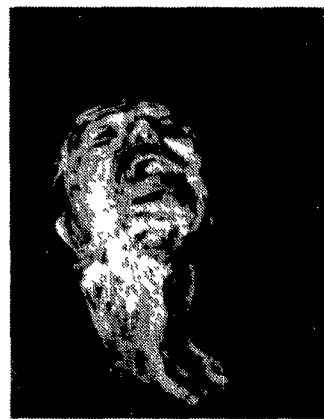
«Il Dolore» - 1987 (Vittorio Miele)