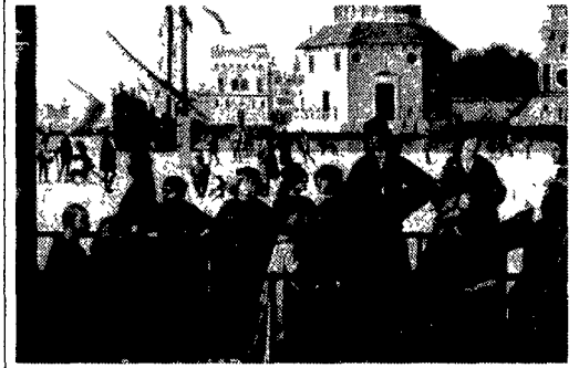
Vittore Carpaccio fu solo l'incantevole «reporter» della società veneziana del Rinascimento? O non fu, piuttosto, l'acuto interprete delle istanze politiche, sociali e religiose della Serenissima? Le vicende che Carpaccio raccontò dipingendo - le favole di San Giorgio, Girolamo ed Orsola (nella foto) - le scrivevano altri? A chiusura della rassegna «Storie dell'arte» sabato 8 giugno Augusto Gentili presenterà il suo libro «Le storie di Carpaccio: Venezia, i turchi, gli ebrei». In via Capraia 72, alle 18.