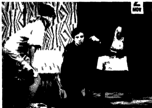
Una scena di «Operina» del gruppo Apriti Cielo al teatro Verdi

Chi li ha visti? Sono cento e forse qualcuno in più i gruppi giovani non sovvenzionati che in Lombardia fanno teatro da professionisti. Ma le sale sono poche, la burocrazia rende difficile ositarli nei circuiti normali: la stampa non trova lo spazio per farli conoscere. Morale: sono il sommerso della nostra cultura teatrale, anche dal punto di vista economico. Ma ecco per portarli in superficie «Scena Prima» sottotitolo Nuovi Gruppi Teatrali in Lombardia: una manifestazione che da martedì 11 a venerdì 14 giugno presenterà ai cuni di questi gruppi. In quattro luoghi milanesi che del teatro giovane: di ricambio generazionale e della ricerca, hanno fatto professione di vita e non solo bandiera il Crt, l'Elfo Teatriditalia, il Teatro Verdi e la Scuola d'Arte Drammatica Paolo Grassi.