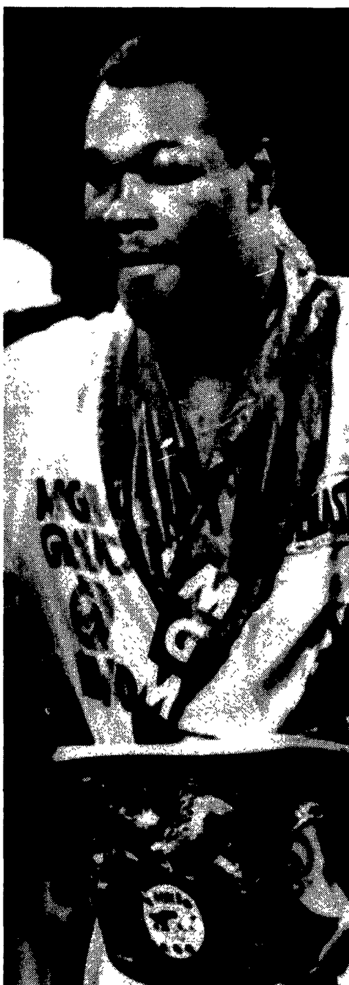
Una foto storica di Larry Holmes

Insomma Larry Holmes è stato un autentico campione degno dei migliori, da Rocky Marciano a Floyd Patterson, da «Big» George Foreman, ad Evander Holyfield che, in tre assalti, mise k.o. «Buster» Douglas il giustiziere di Mike Tyson, inoltre vincitore anche di Riddick Bowe, forse il migliore peso massimo attuale.