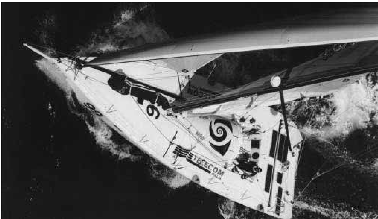
Giovanni Soldini a bordo della sua imbarcazione

Nè i multiscari, nè i 60 piedi sono riusciti in questa impresa.