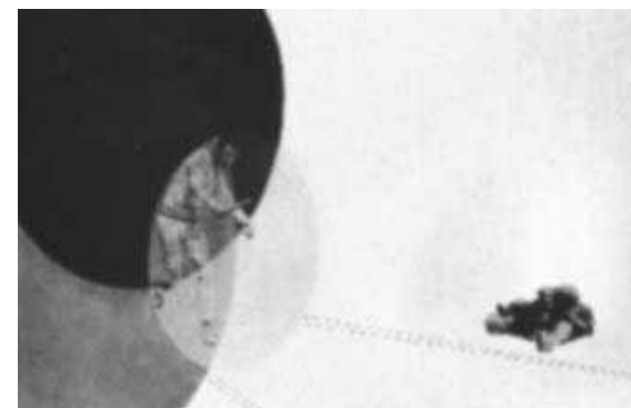
Lazlo MoholyNagy: fotoplastica, 1925 ca.

■ I rapporti tra arte e fotografia negli anni tra le due guerre vengono indagati da una mostra aperta fino al 31 luglio alla Galleria Milano (via Turati 14); la rassegna, curata da Angela Madesani, presenta sia opere di grandi maestri fotografati dai loro stessi autori - è il caso, per esempio, di una scultura di Constantin Brancusi -, sia creazioni artistiche realizzate con l'aiuto del mezzo fotografico. Futurismo, astrattismo, Dada, Bauhaus, Nuova oggettività: tutti i grandi movimenti europei d'avanguardia accompagnati dalla sperimentazione sulla fotografia. L'americano Man Ray e il nostro Luigi Veronesi realizzarono i fotogrammi, immagini dall'aspetto misterioso, ottenute con una tecnica particolare: si posava un oggetto sulla carta fotosensibile che veniva poi esposta alla luce, così che sul foglio rimanesse soltanto l'ombra, l'evocazione dell'oggetto. Il francese Gérard Vuillamy preferiva disegnare direttamente sulla carta fotosensibile.