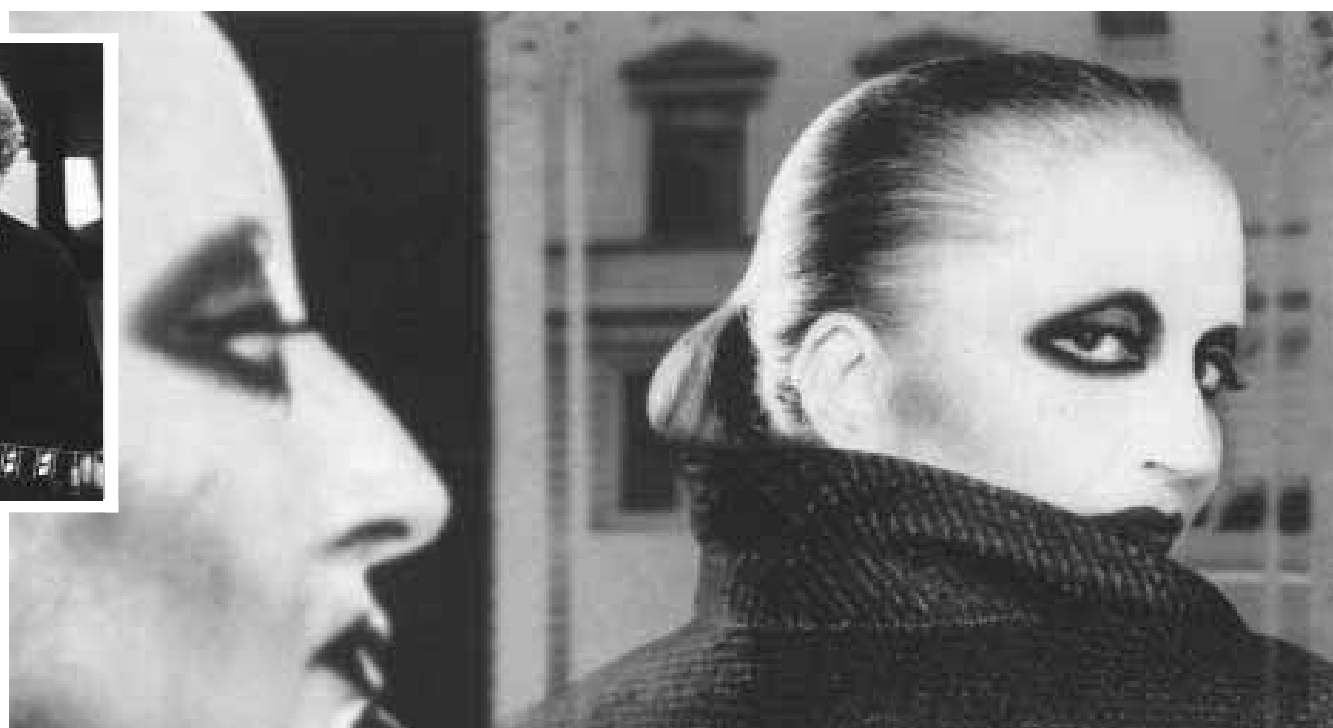
Il volto di Mina sulla copertina di un disco. A sinistra in alto, Francesco Guccini, sotto, Luigi Tenco